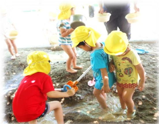
どろんこ大好き♡裸足が気持ちいい