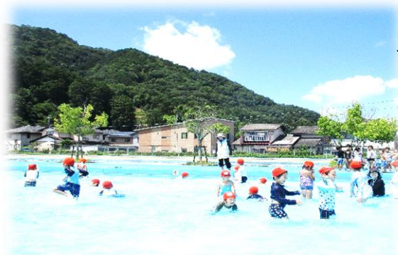
青い空の下、広い市民プール!最高で～す